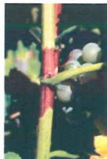
Egyetlen fásodás