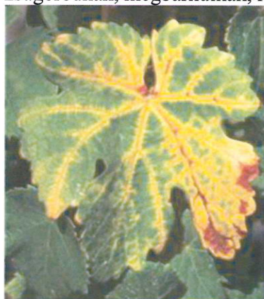
Levél sárgulás

Augusztus és szeptember hónapokban a főerek mentén krémsárga foltok jelennek meg, amelyek fokozatosan terjednek a levélfelületen, végül a teljes levél elsárad. Az így elhalt, megkeményedett levelek ősszel később hullanak le, mint az egészségesek. Télen a be nem érett vesszők elfeketednek és elpusztulnak. A következő tavasszal a megmaradt rügyekből keletkező virágzat leszárad, kevesebb fürt képződik. Késői fertőzés esetén a bogyók zsugorodnak, megbarnulnak, rossz ízűvé válnak.