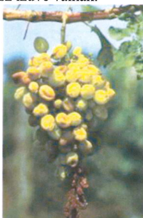
Zsugorodó bogyók