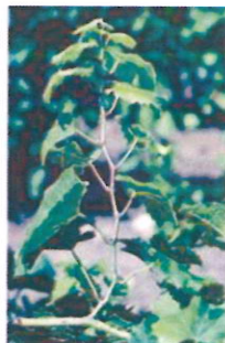
Ízközök rövidülése