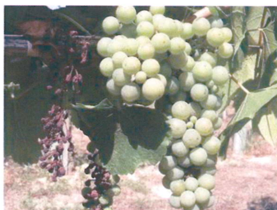
Megbarnult bogyók